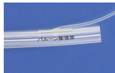
印刷表示 (バルーン膨張方向を示す)